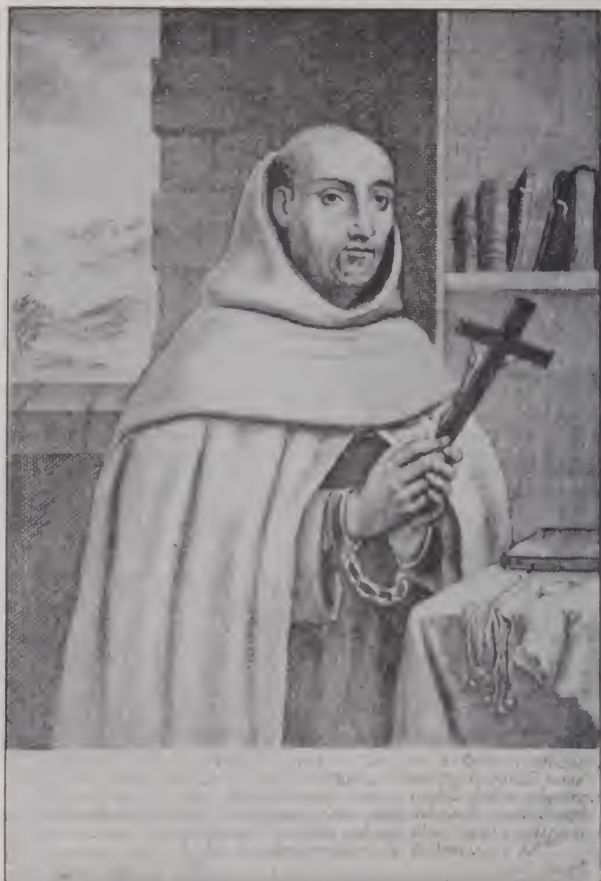
Retrato del P. Gracián: grabado de R. Collin Bruselas 1614, año de su muerte, a los 69 de edad